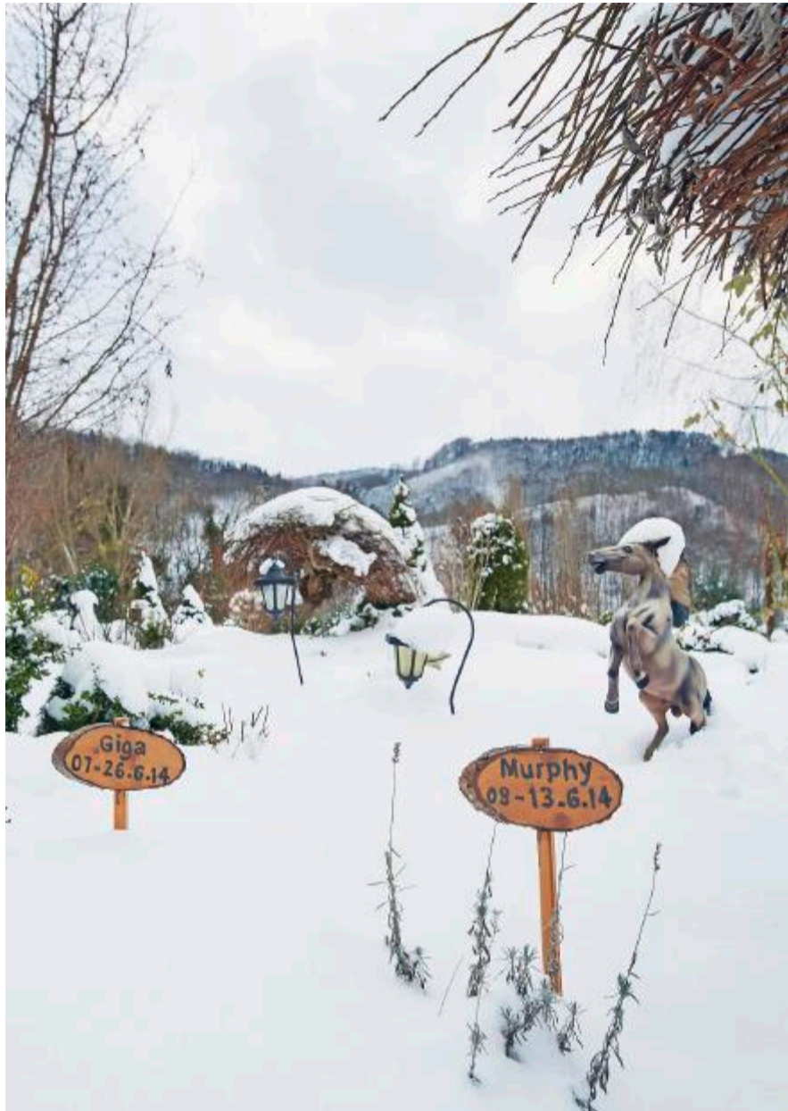
Tiergräber sind markiert, Menschengräber sind nur für die Angehörigen erkennbar.